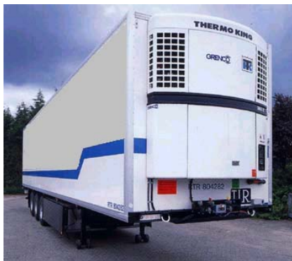
Waar staat die trailer ?

Afkortingen in tabel AB = Accredis-Basic AO = Accredis-Online AOL = Accredis-Online-Locator AL = Accredis-Locator MS = Microsoft