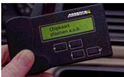
Bedieningsunit Basic en Online